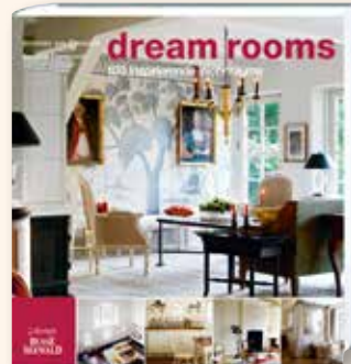
Dream Rooms ISBN 978-3-7724-7307-4