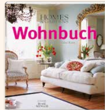
Homes & Gardens Wohnbuch ISBN 978-3-7724-7329-6