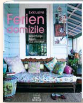
Exklusive Feriendomizile ISBN 978-3-7724-7330-3

Weitere Bücher aus dem Verlag BusseSeewald